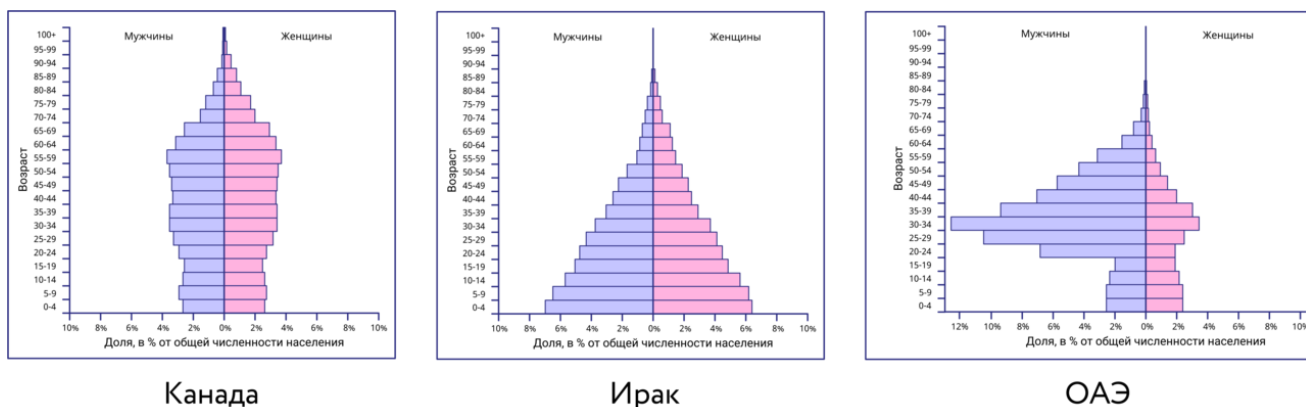
рисунк 2. - Половозрастные пирамиды

В половозрастных пирамидах находят отражение и крупные исторические события, оказавшие влияние на изменение численности населения, прежде всего войны.