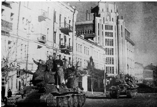
Рис. 5. Освобождение Киева

И уже 6 ноября, перед годовщиной революции, 1-й Украинский фронт под командованием Н.Ф. Ватутина освободил Киев (Рис. 5).