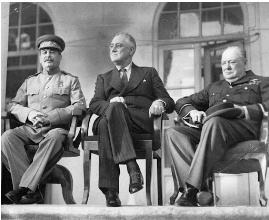
Лидеры «Большой тройки» на Тегеранской конференции.

В ноябре — декабре 1943 г. в Тегеране состоялась первая встреча «Большой тройки» , на которой Рузвельт, Черчилль и Сталин обсудили вопросы послевоенного устройства мира и координации действий на 1944 г. Сталин был заинтересован в помощи союзников и демонстрировал готовность идти на уступки. В мае 1943 г. был распущен Коминтерн , считавшийся орудием вмешательства Москвы в дела других стран. На Тегеранской конференции также определили дату и место открытия Второго фронта . До этого США и Англия, ссылаясь в первую очередь на большие трудности в войне с Японией, отказывались перейти к более активным действиям в Европе. На конференции разгорелись споры относительно места и времени высадки англо-американских войск. В итоге было решено открыть Второй фронт десантной операцией на севере Франции не позднее лета 1944 г.