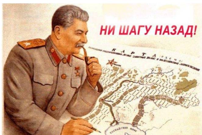
Рис. 2. Приказ № 227

Этот приказ до сих пор вызывает у историков противоречивые оценки. С одной стороны, он действительно помог повысить военную дисциплину, но с другой – привел к неоправданным потерям, потому что невозможно было отступить даже в тех ситуациях, когда тактически это было оправданно и спасло бы жизнь целым подразделениям.