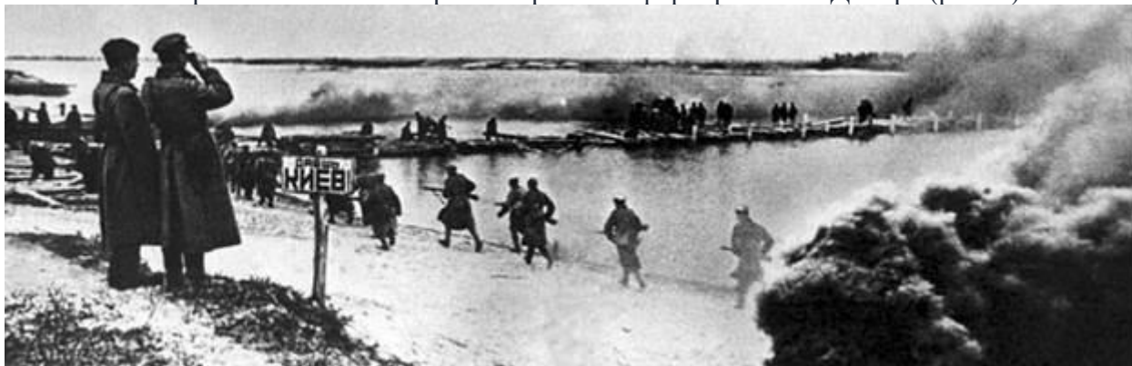
Рис. 4. Форсирование Днепра

В начале октября 1943 советская армия перешла к форсированию Днепра (рис. 4).