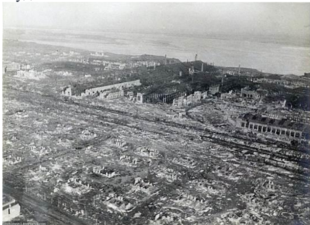
Рис. 1. Руины Сталинграда

На севере и юге немцам удалось прорваться к Волге, но советские воины не сдавались и продолжали оборону. Уличные бои продолжались до конца ноября, и захватить Сталинград полностью немцам так и не удалось.