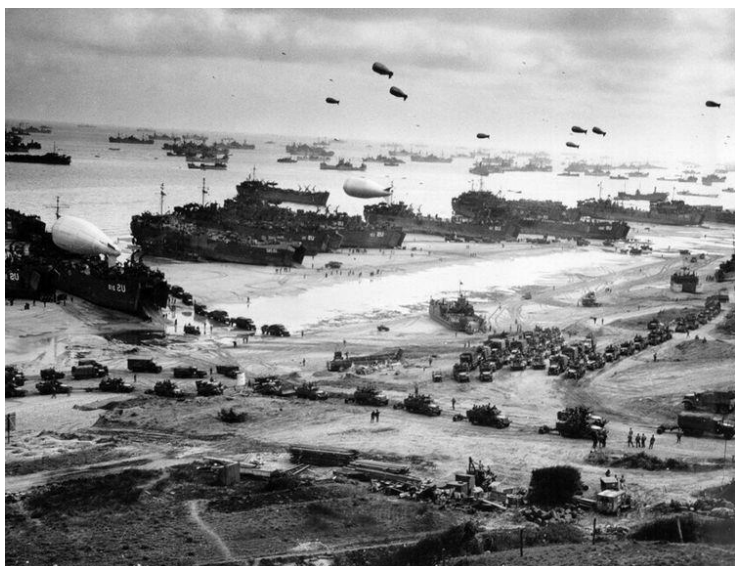
Высадка в Нормандии.

Попытки немецких войск сбросить десант в море успеха не имели, тем более что вскоре советские войска начали мощное наступление в Белоруссии (операция «Багратион»), и силы противнику понадобились прежде всего там. В августе войска союзников высадились и на юге Франции.