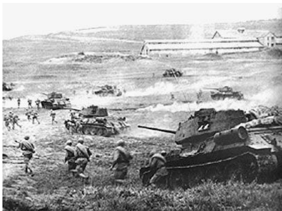
Рис. 3. Сражение под Прохоровкой

С 23 июля под Курском началось успешное контрнаступление.