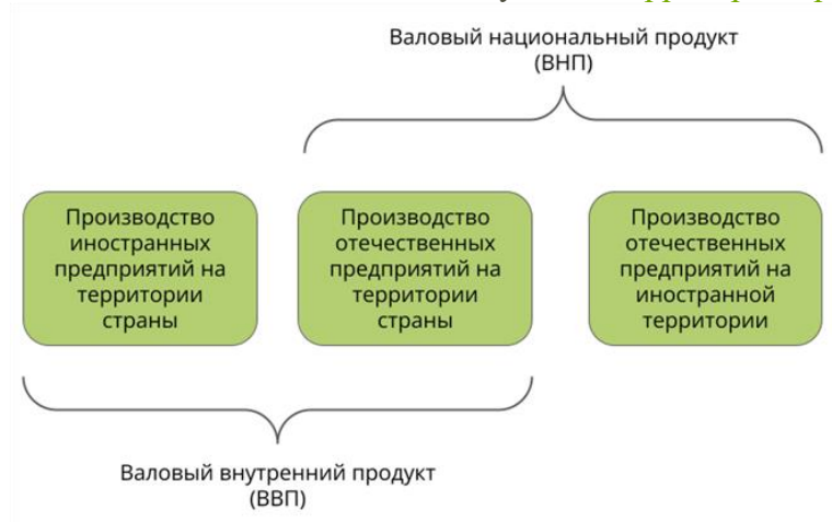
Рис. 1. ВВП и ВНП

ВНП отличается от ВВП только учётом территории производства .