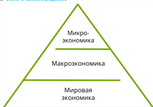
Рис. 1. Уровни экономики

Мировая экономика. На этом уровне изучается экономика всего мира: международная торговля, мировые финансовые кризисы, экономические союзы государств. Этот уровень появился в ходе глобализации .